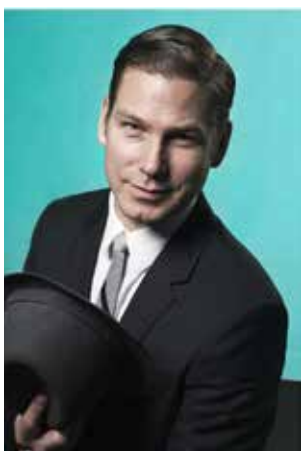
Magnus Silfverberg VD OCH KONCERNCHEF, BETSSON AB